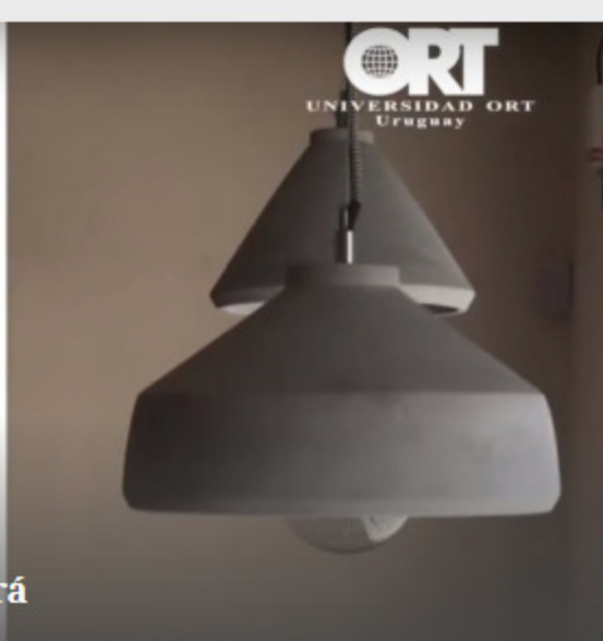
Hasta marzo de 2018 estará abierta al público la