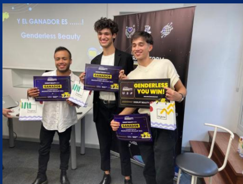
Ganadores 2022 Uno de ellos trabaja actualmente en LOREAL