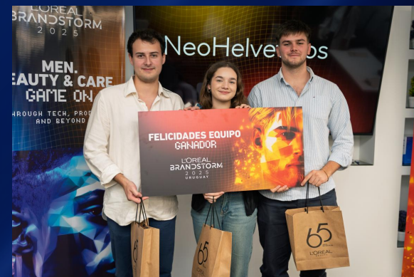
Ganadores/a 2025 Representaron a UY en ARGENTINA