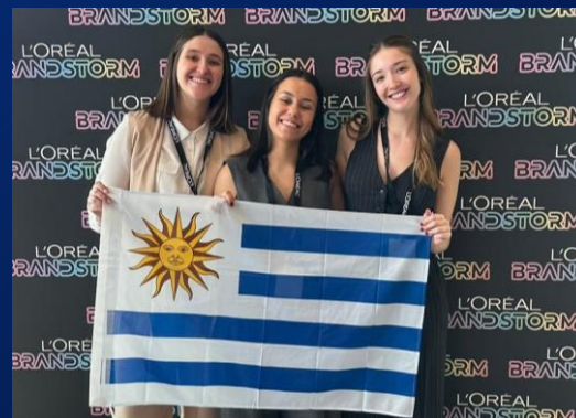
Ganadoras 2024 Representaron a UY en FRANCIA