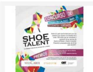
Shoetalent: concurso de diseño de calzado organizado por Stadium y la ORT

En la última instancia del concurso tres finalistas producirán su colección de calzado en serie para comercializar en la cadena. El modelo más vendido será ganador de una Mac book pro y una pasantía laboral en la empresa.