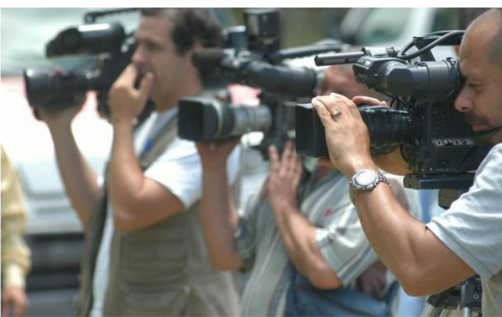
La ley establece amplias pautas de control, que son rechazadas por los operadores.