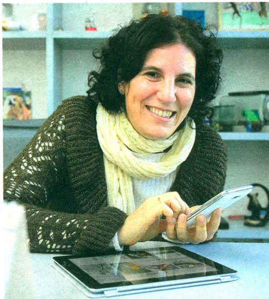
Oberlander. Compatibilizar familia y trabajo es un reto.

La creatividad no distingue sexos pero hay una sensibilidad femenina que aporta diferencias a la mirada del mundo y la publicidad.